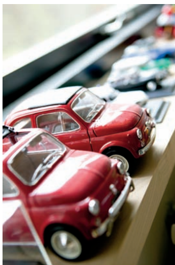
Modelbilerne i Siegmunds vindueskarm er af Fiat 500 og Citroën DS Break, som familien har fået i fuld størrelse.

– Vi køber ikke kunst for at investere, men fordi vi kan lide det. At nogle af kunstnerne så er blevet mere etablerede med årene, er en anden sag.