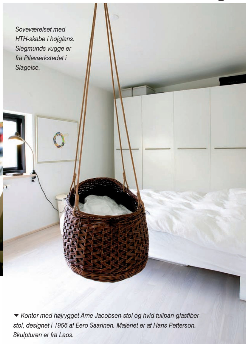
Soveværelset med HTH-skabe i højglans. Siegmunds vugge er fra Pileværkstedet i Slagelse.