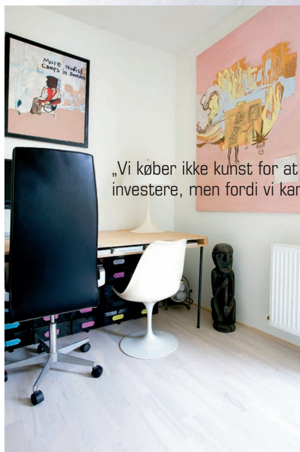
▼ Kontor med højrygget Arne Jacobsen-stol og hvid tulipan-glasfiberstol, designet i 1956 af Eero Saarinen. Maleriet er af Hans Petterson. Skulpturen er fra Laos.

„Vi køber ikke kunst for at investere, men fordi vi kan lide det“